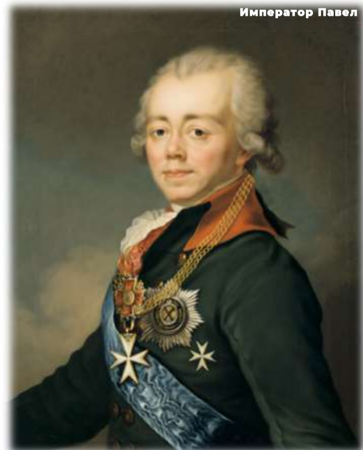
Император Павел I

странявший женщин от престола. Появилось правило перехода короны только по мужской линии. Павел начал ослаблять дворянство. Именно оно переживало свой расцвет при Екатерине. Возвращались телесные наказания. Дворян, уклонявшихся от службы, теперь могли судить. Вроде бы строго. Но одновременно с этим, Павел освободил политических заключенных. Например, знаменитого Тадеуша Костюшко, который участвовал в мятеже в Польше (в то время Польша входила в состав Российской империи). Более того, за время правления Павел не отметился ни одним смертным приговором. То есть, его нельзя назвать строгим императором. Просто Павел хотел уничтожить то, что создала Екатерина, а рас-