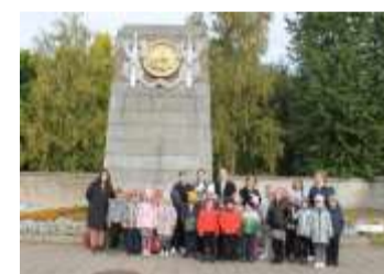
Мемориал Воинское захоронение