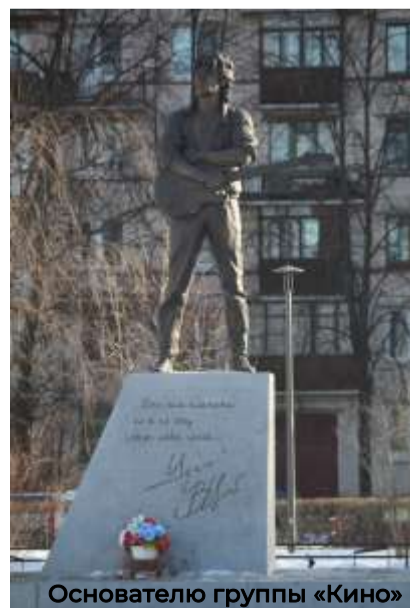
Основателю группы «Кино»

Практически все известные достопримечательности находятся в центре. Но есть исключение. Памятник советскому музыканту, основателю и лидеру группы «Кино», Виктору Цою, расположен в Кировском районе.