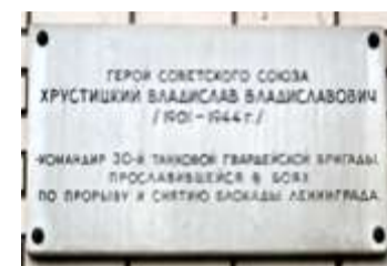
Мемориальная доска на улице Танкиста Хруститского