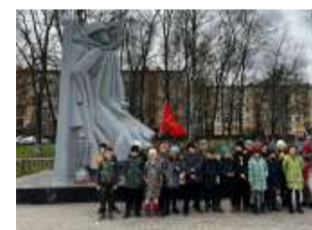
У памятника народным ополченцам