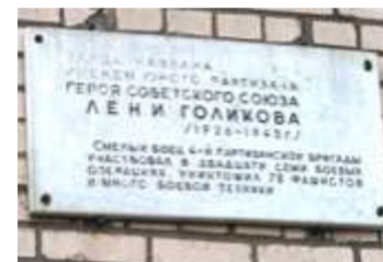
Мемориальная доска на улице Лёни Голикова