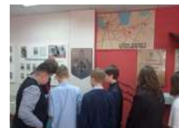
В музее гимназии

Главный редактор: К. Соболева, 9б; Корректоры: С. Пугачёва, 8а; Фотограф: П. Кудряшова, 8а; Выпускающий редактор: П. Радзиевский, 8а; Технический редактор: М. Дадека, 8а; Корреспонденты: ученики 7аб, 8аб, 9аб, 10а, 11а; Шеф-редактор: О. О. Горнова. ФОТО из архива Гимназии из свободных источников Интернет