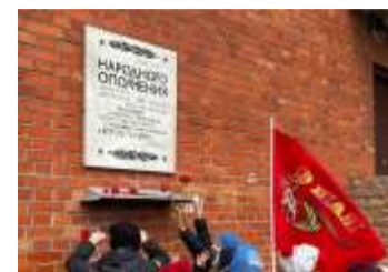
Мемориальная доска на проспекте Народного Ополчения